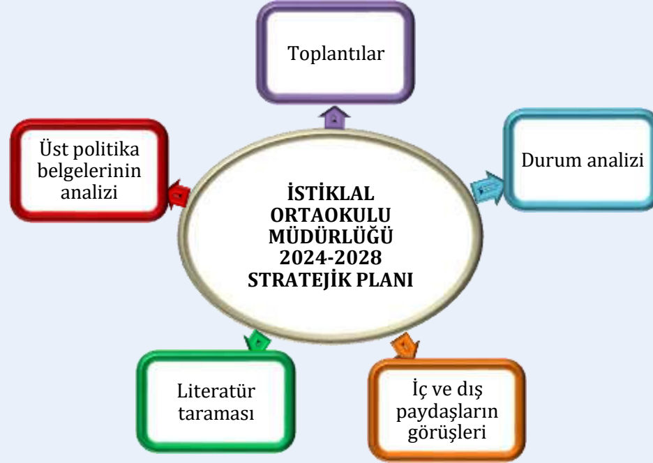
Şekil 1: Stratejik Plan Hazırlık Aşamaları