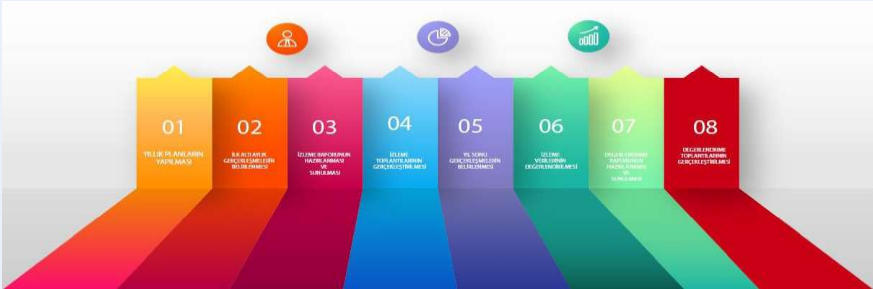
Şekil 5: İzleme ve Değerlendirme Süreci

İzleme ve değerlendirme sürecinin işleyişi ana hatları ile aşağıdaki şekilde özetlenmiştir. Müdürlüğümüz 2024–2028 Stratejik Planı'nda yer alan performans göstergelerinin gerçekleşme durumlarının tespiti yılda iki kez yapılacaktır. Ara izleme olarak nitelendirilebilecek yılın ilk altı aylık dönemini kapsayan birinci izleme kapsamında, Okul Müdürlüğü tarafından birimlerinden sorumlu oldukları performans göstergeleri ve stratejiler ile ilgili gerçekleşme durumlarına ilişkin veriler toplanarak konsolide edilecektir. Performans hedeflerinin gerçekleşme durumları hakkında hazırlanan “Stratejik Plan İzleme Raporu” Okul Müdürü, Müdür Yardımcıları, Öğretmenler ve kurum içi paydaşların görüşüne sunulacaktır. Bu aşamada amaç, varsa öncelikle yıllık hedefler olmak üzere, hedeflere ulaşılmasının önündeki engelleri ve riskleri belirlemek ve yıllık hedeflere ulaşılmasını sağlamak üzere gerekli görülebilecek tedbirlerin alınmasıdır.